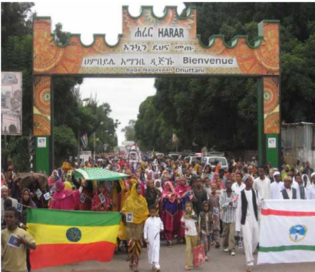
ኡመትዚኻ ዚሐረሪ ሚሊኒየምቤ ዛረኡው ዚአድዳተቃጠርት ኪሰሆት

ሐረርጌይሌ ቆጥ ጌይ ዝቱ ሐረርጌይ መጋቢ ዩ አያም ዋ ዩ አመት ተኤሰሰቲሌ ከስተንቤ ዝትቆጩ አያም አይንበርማም አብዘህ ታሪኽ ኡሱአት 1200ቤ ዘይእነሰ ሰንኒ ሀሌቤ ይትካህላሉ። ዩው እድዴቤ የረግዚኩተ ናሻመ